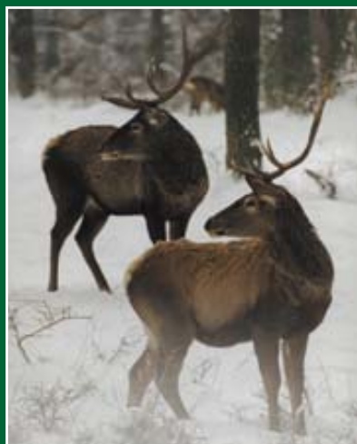
(Hátsó) fiatal (4 éves), hosszú, vastag, villás koronával, jó középággal – kímélendő. (Első) fiatal (4 éves), gyenge, dárdás agancsú – lőhető