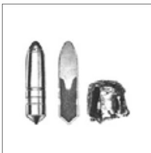
TIG-lövedék 7 x 64 (10,5 g)