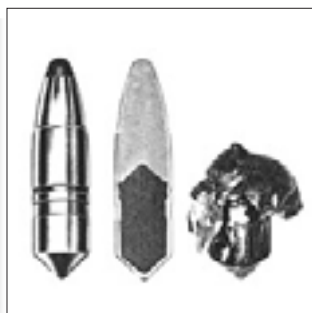
TIG-lövedék 9,3 x 62 (19 g)