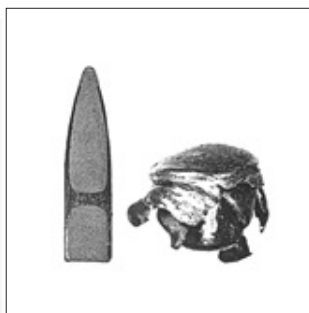
Nosler-lövedék .30-06 (9,2 g)