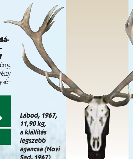
Lábad, 1967, 11,90 kg, a kiállítás legszebb agancsa (Novi Sad, 1967)

A Szövetség fennállásának e viharos szakasza egybeesik a háború utáni újjáépítés hároméves tervével, a túlfeszített iparosítás első ötéves tervével. A vadgazdálkodás szempontjából kiemelendő a két tervidőszak alatt a 450 ezer ha erdőfelújítás, a 104 ezer ha új erdő telepítése. Erre az időre esik az erdőgazdálkodás fejlesztésére kiadott minisztertanácsi határozat, az Országos Erdészeti Főigazgatóság létrehozása, a vadgazdálkodás szakmai irányításának OEF alá helyezése. A háborús károkból és a tervutasításos rendszer túlhatalmaitól kilábaló vadgazdálkodásban erdészeti irányítással teremtődtek meg a vadállomány számbavételének és szakszerű hasznosításának feltételei, alakultak ki a