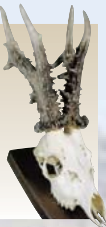
Jászkisér, 1975, 770,00 g, magyar rekord (1996–jelenleg is)

ként a törvény elodázását segítette, a maga szemszögéből indokoltan, mert az erdei károk térítése megoldhatatlan feladat elé állította volna a vadgazdálkodókat.