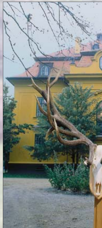
Karapancsa, 1986, világrekord (1986-1990)

érdekek képviselése. Az erdőgazdaságban erőteljesen folyt a mezőgazdasági területek fásítása, 50 ezer hektáron a nyártelepítés. A fakitermelés 7,4 millió m 3 -re nőtt, ennek nyomán alakult a vágásfelújítási kötelezettség, a felújításban növekvő fajok, a fenyők telepítése. A megnövekedett vadállomány az új közgazdasági környezetben fokozottan került szembe az erdészeti érdekekkel. A szakmai körök, az erdőfelügyelet, a hatósági ellenőrzés szigorítását követelték, az erdő-vad összehango-