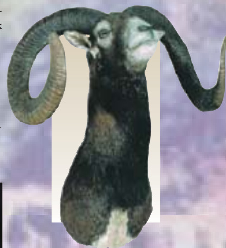
Telki, 1986, 97,60 cm, magyar rekord (1986–jelenleg is)

Összegezés: 1945–1990 között mintegy 70 törvény, törvényerejű rendelet, miniszteri rendelet és utasítás foglalkozott a vadászattal és a vadgazdálkodással, benne a vadásztársaságokkal és a MAVOSZ-szal. A szocialista társadalmi-gazdasági viszonyok behatárolták a jogalkotók mozgásterét, a vadászat szervezeteinek működését. Ugyanakkor a MAVOSZ az érdekképviseleti munkájában a napi politikán felülemelkedve, korlátait tágítva helyezte előtérbe a mindenkor tagtségát mozgató érdekeket: a vadállomány védelmét, hasznosítását, újratermelését. Történetének fontos állomásai kötődnek vadállományunk háború utáni helyreállításához, vadászati hagyományaink megőrzéséhez, a gazdaságirányítás változásából