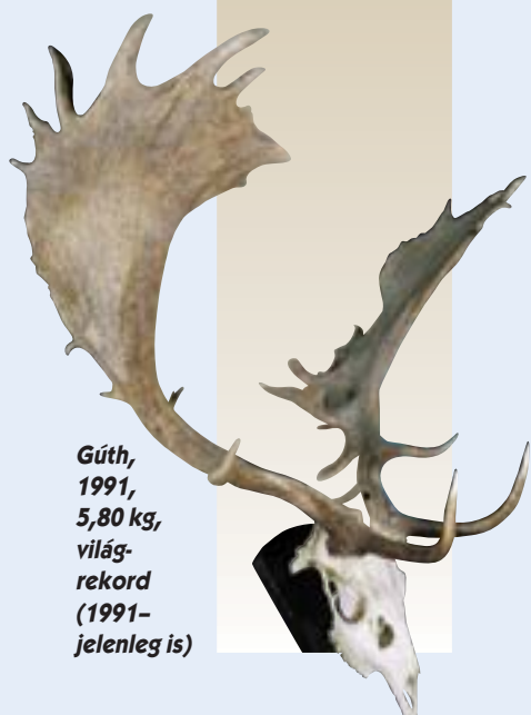
Gúth, 1991, 5,80 kg, világ-rekord (1991–jelenleg is)

lásának új alapokra helyezését, párt és kormányzati szintű döntések meghozatalát a vadkárokról, a vadászatról. Nemzetközi téren az 1972. évi stockholmi környezetvédelmi konferencia, az 1971. évi Ramsari Egyezmény, illetve a vonuló vad, a vízivad, az élőhelyek stb. védelmét célzó további egyezmények a vadászat szerepének, szabályozásának új megfogalmazását vetették fel.