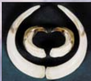
Szin, 1995, 28,15 cm, magyar rekord (1996–2000)

mi-gazdasági változásokra, elismerve, hogy az egypártrendszerű hatalom minden következményét magán viselte a társadalom, benne a vadászat és a MAVOSZ is. E politikai-társadalmi közeg határozta meg a Szövetség működési körét, munkamódszerét. A megújuló