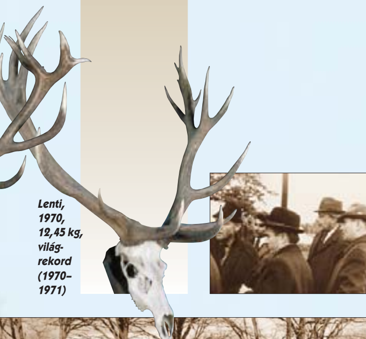
Lenti, 1970, 12,45 kg, világ- rekord (1970- 1971)