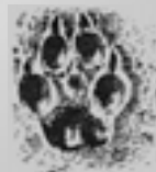
A róka jobb első lábnyoma

Sípólásra legjobb a szélcsendes idő. Ekkor van a legtöbb esélyünk rá, hogy valamelyik róka meghallja a síp hangját, mert körös-körül egyformán terjed a hang. Ha viszont erő-