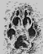
A róka jobb hátsó lábnyoma