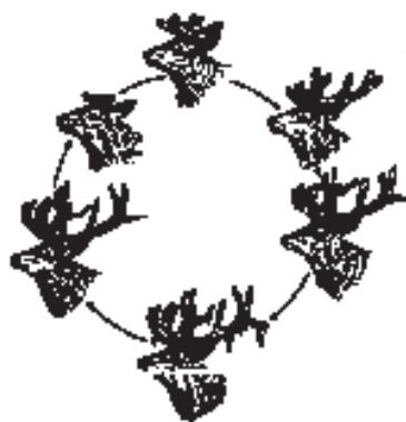
A gímszarvas agancsnövekedésének éves ciklusa

tő. A bikaborjak veszteségei nagyobbak, ugyanis nagyobbra kell nőniük, valamint a hím ivarúak kevesebb zsírtartalékot képeznek.