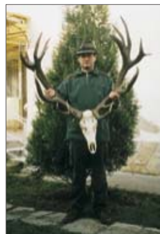
A szerző egy golyóra érett kapitális bikával

Erre emlékeztet példa az 1979-80-ban felhúzott kaszói kerítés. E kerítés fennállásának „dicsőséges” tíz évében statisztikailag kimutató, hogy a mesterségesen felduzzasztott gímszarvasállomány milyen minőségi hanyatláson ment keresztül. Néhány év alatt a bikák testsúlya jelentősen csökkent, a trófeák súlya, az aranyérmesek aránya, a nagyobb trófeasúlyú bikák aránya jelentősen elmaradt a kerítés előtti időszakhoz képest. Ezek a mutatók