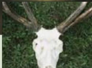
Középkorú bika közepes hosszúságú agancstöve