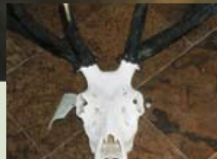
Öreg bika rövid és vastag agancstöve

A gímszarvas bőgési – szaporodási sikere pozitív kapcsolatban van a testmérettel, kondícióval, de annak nincs egyértelmű jele, hogy korrelálna az agancs nagyságával. A túl sok ágú agancs nem számít előnyösnek a bőgésben lezajló küzdelmekben. A szárhossz, a hosszú szemág, a jó kondíció a nagy testsúly azonban fontos és előnyös. A csapatban betöltött hierarchia ezen ismérvek alapján alakul ki. Ez a hierarchia az agancs levetésének idején időlegesen megváltozhat, ugyanis az öreg bikák előbb hullatják el agancsukat.