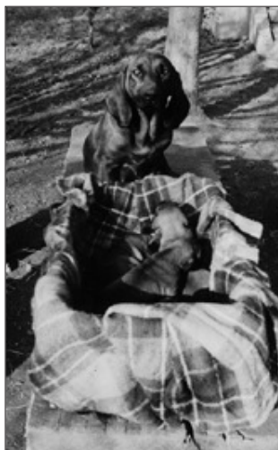
Háromhetes vérebalom; ebben a korban még semmi nem dőlt el

Az anyjától leválasztott kölyök, amelyik jó étvágygal, önállóan eszik, gyakorlatilag hazavihető. Leghamarabb erre 6 hetes kor körül szokott sor kerülni, de saját tenyésztői tapasztalatom (eddig néhány vizsla- és tascóalom mellett 8 vérebalmot volt módomban felnevelni) azt mondatja velem, hogy a születési kör-